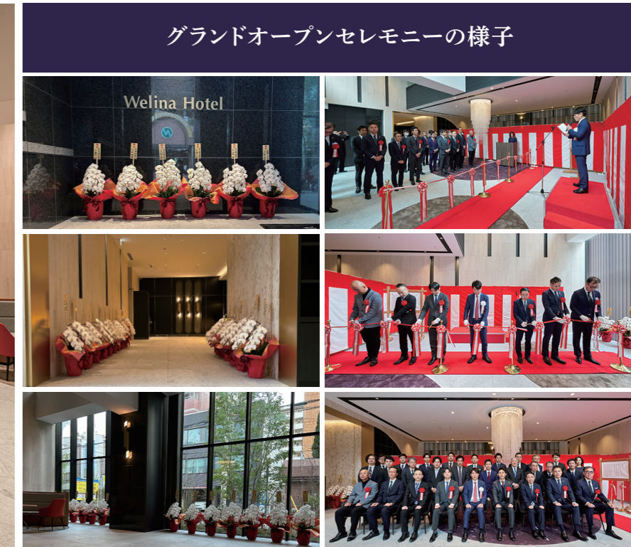
グランドオープンセレモニーの様子